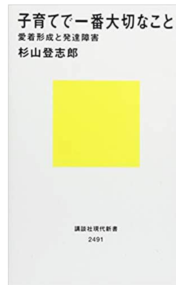
子育てで一番大切なこと 講談社現代新書