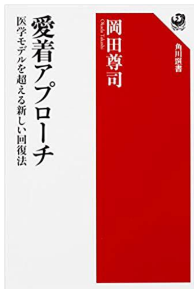
愛着アプローチ 角川選書