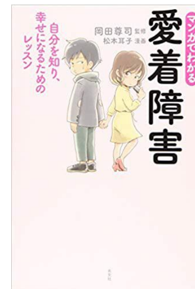
マンガでわかる愛着障害 光文社