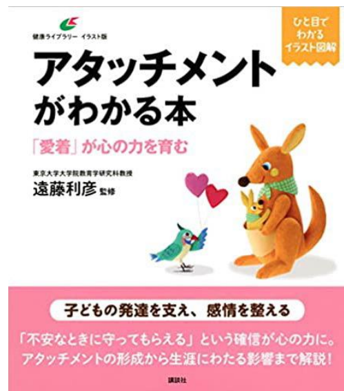
アタッチメントがわかる本 講談社