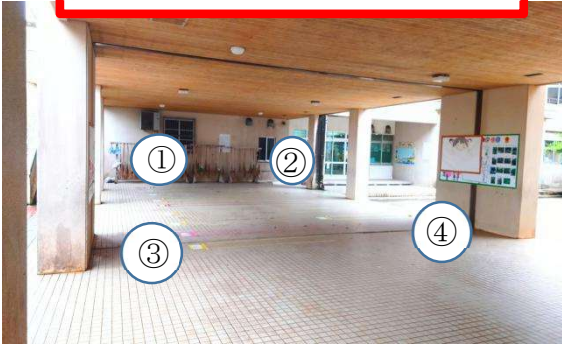
「こども園側」屋根下ピロティ